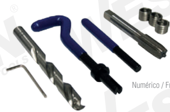
Numérico / Fraccional

Usado industrial Cada juego incluye broca, machuelo STI para inserto helicoidal, insertos y herramienta para instalar y arrastrar