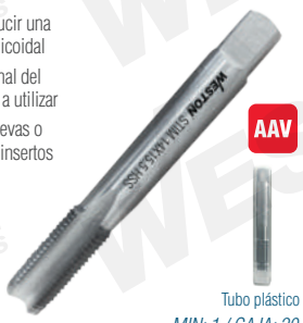
Tubo plástico MIN: 1 / CAJA: 20

Fabricado con acero de alta velocidad Usado con insertos Sobredimensionado para producir una rosca que acepte un inserto helicoidal Marcados con la medida nominal del machuelo y el paso del tornillo a utilizar Especial para hacer cuerdas nuevas o reparar existentes para colocar insertos helicoidales